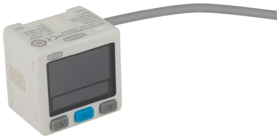
Реле вакуума и давления VS-V/P-W-D-K-3C-D